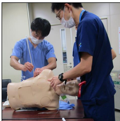
〔 トロッカーカテーテルの挿入方法 〕