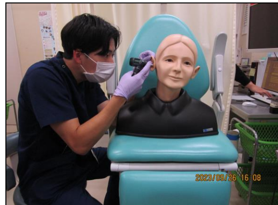
〔 耳鏡を使用して耳の中を観察する 〕