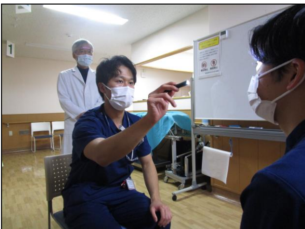
〔 対光反射観察 〕