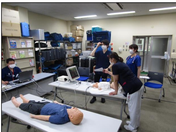
〔 シミュレーション 〕