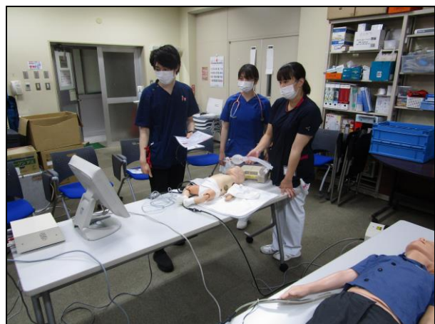
〔 シミュレーション 〕