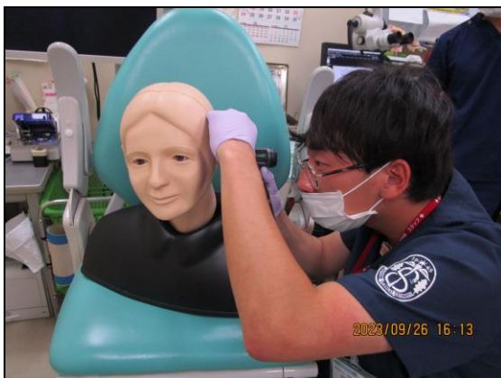
〔 耳の様々な病状を確認する 〕