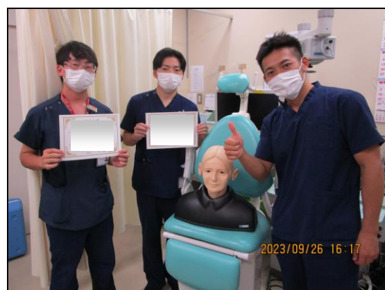
〔 修了の記念撮影 〕