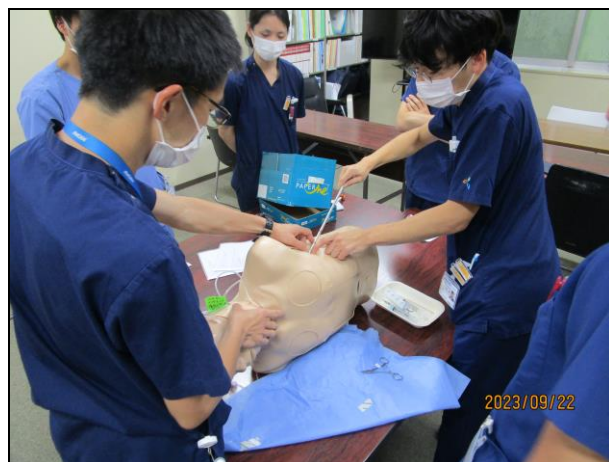
〔 トロッカーカテーテルの挿入方法 〕