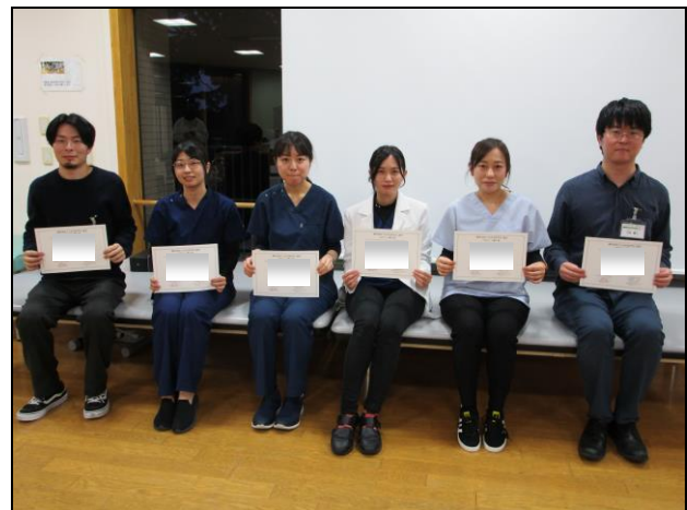
〔 修了の記念撮影 〕