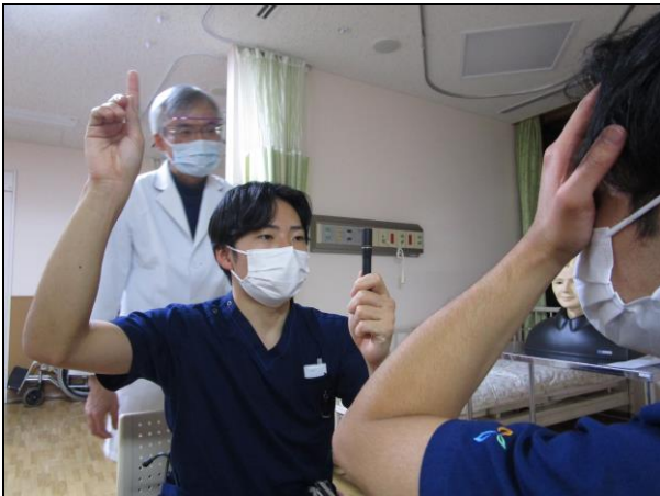
〔 対座法による視野検査 〕