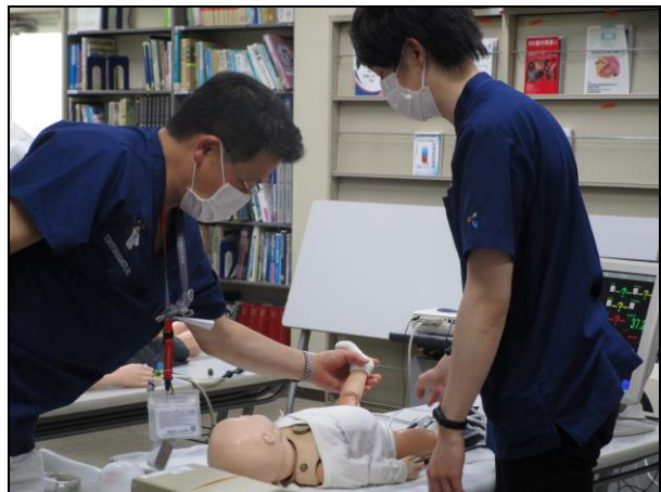
〔 蘇生方法を学ぶ 〕