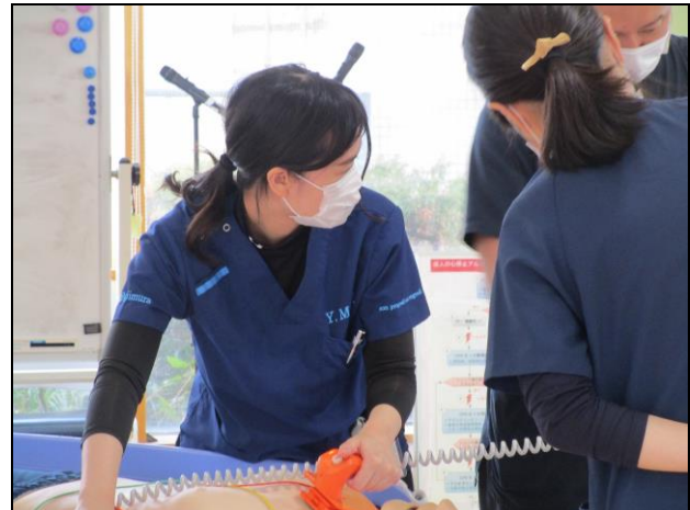
〔 除細動シミュレーション 〕