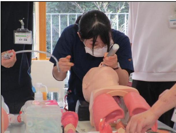
〔 気道挿管シミュレーション 〕