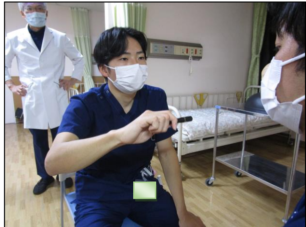
〔 垂直眼球運動検査 〕