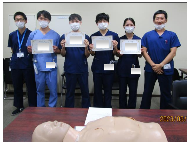
〔 修了の記念撮影 〕