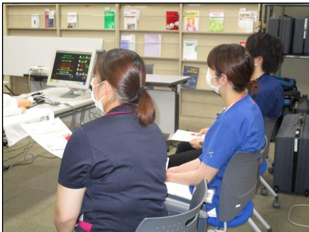
〔 評価方法の方法論を学ぶ 〕