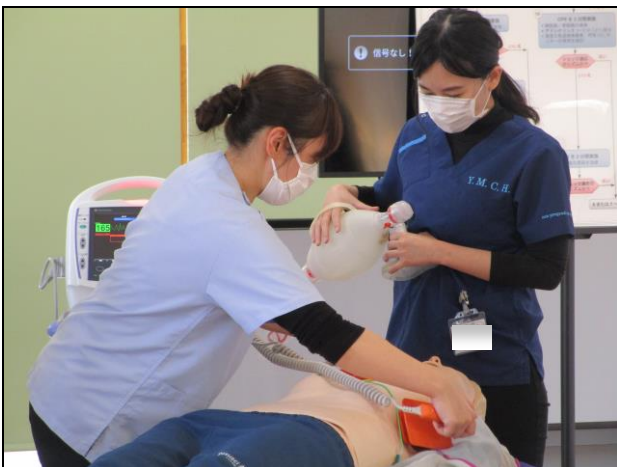
〔 急変（心停止）への対応 〕