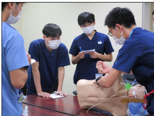
〔 縫合のシミュレーション 〕