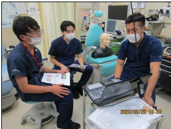
〔 耳の仕組みを学ぶ 〕